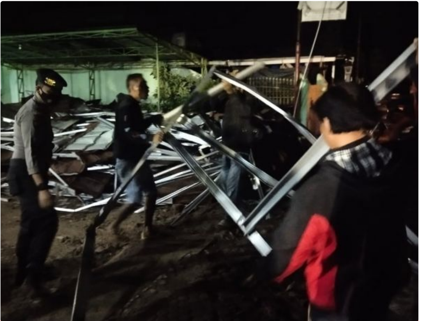
Atap Rumah Sakit Najwa Medika Kelurahan Taman Asri Baradatu Rusak Diterjang Angin Puting Beliung

WAY KANAN , - Hujan deras dan angin kencang mengakibatkan atap rangka baja Rumah Sakit (RS) Najwa Medika di Kelurahan Taman Asri Kecamatan Baradatu Kabupaten Way Kanan, roboh, Selasa(9/2/2021)